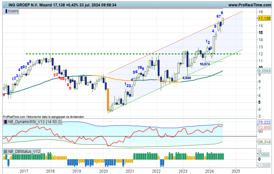
Grafiek uit ProRealTime Software