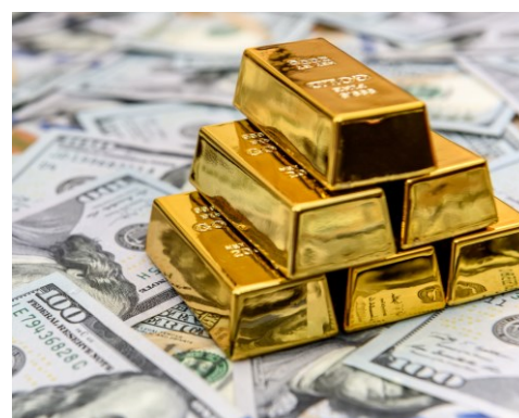
Investor Relations, Yahoo Finance en Morningstar.com.

De waarde van uw belegging kan fluctueren. In het verleden behaalde resultaten bieden geen garantie voor de toekomst.